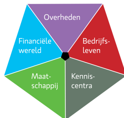
Figuur 1: De Maatschappelijk Vijfhoek

De VRWI suggereert in dit opzicht de maatschappelijke vijfhoek als model (zie Figuur 1.). De uitdagingen zijn van die aard en dusdanig complex dat de overheid ze niet alleen moet aangaan, maar in samenwerking met andere actoren.